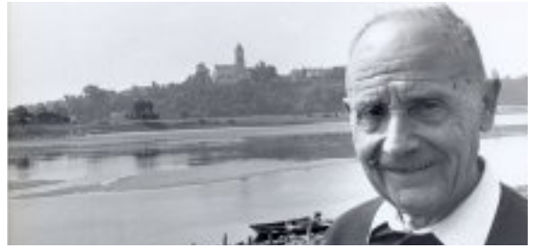
La Maison Julien Gracq L'écrivain et les lieux

Julien Gracq, écrivain français du xx e siècle, est né le 27 juillet 1910 à Saint-Florent-le-Vieil sur les bords de la Loire, commune dans laquelle il finira ses jours. Décédé en 2007, Julien Gracq lègue sa maison et un ancien grenier à sel à la ville de Saint-Florent-le-Vieil, pour en faire un lieu de repos et de travail pour les écrivains, artistes et chercheurs. Le Grenier à sel est ouvert au public. Il est doté d'une Chambre des cartes et d'une grande bibliothèque. Sa maison, elle, est devenue le lieu des résidences.