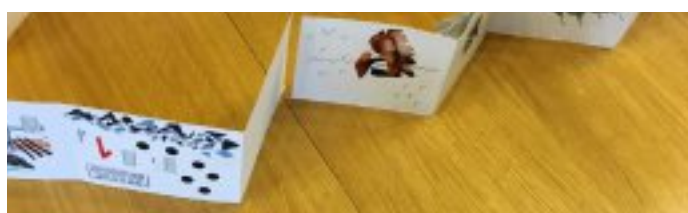
Travaux d'élèves après un atelier d'écriture plastique avec l'artiste Nelly Buret.

Merci encore pour votre accueil et pour avoir permis aux élèves de vivre une journée autour de la littérature et de l'œuvre de Julien Gracq.